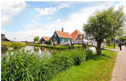
Keukenhof, Zaanse Schanz